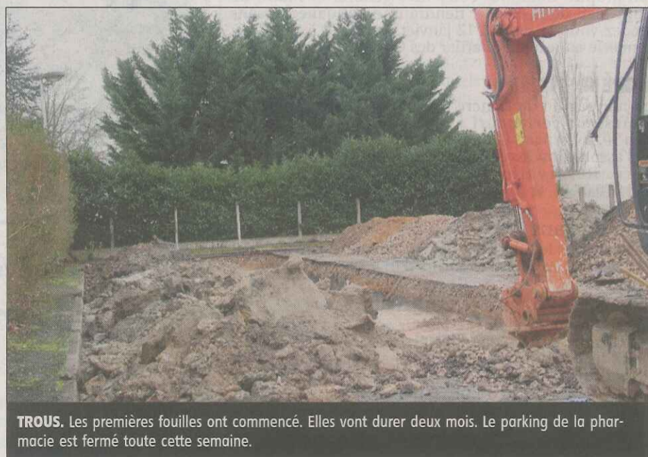
TROUS. Les premières fouilles ont commencé. Elles vont durer deux mois. Le parking de la pharmacie est fermé toute cette semaine.

Des fouilles qui ont été décidées par le préfet, et qui devraient retarder un peu plus le projet d'urbanisation et de réhabilitation initié par la ville en 2008. Cette opération prévoit la construction d'une