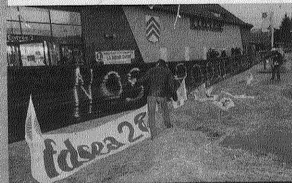
PRESSION. Les négociations entre les agriculteurs et la grande distribution doivent se terminer fin janvier.